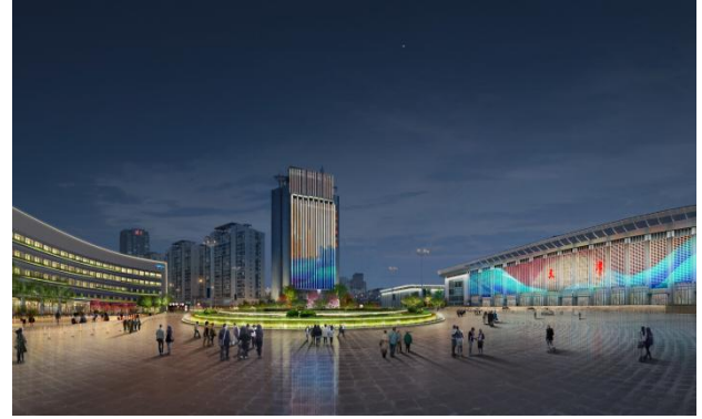
天津后广场景观环境提升改造项目夜游灯光工程 EPC 工程总承包