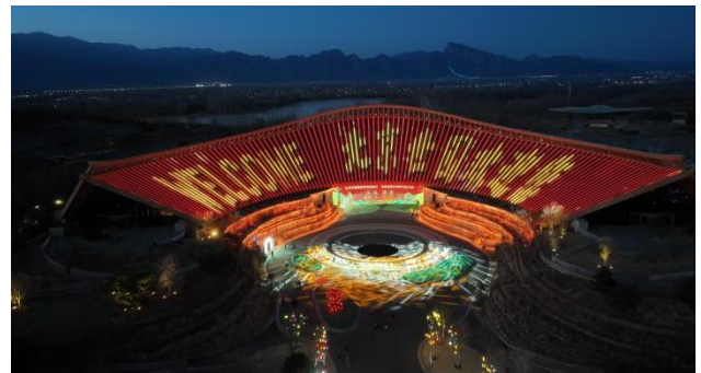
北京世园国际旅游度假区夜游灯光项目