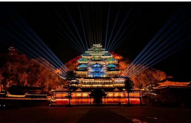
蚩尤九黎城夜游演艺、乌江画廊提档升级 EPC 项目 (二) 开拓智慧城域业务，稳步推进补能业务