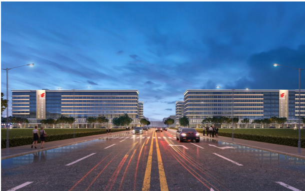
大兴国际机场国航基地项目