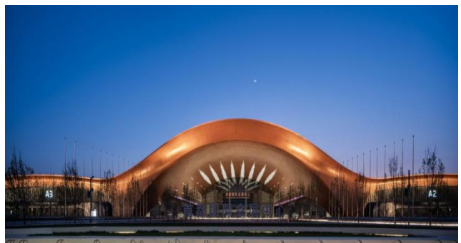
新国展二期建筑泛光照明设计项目