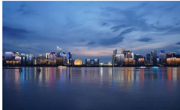
钱塘江北岸城市照明提升（钱江新城段）项目