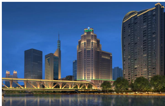
进步广场项目泛光照明设计项目