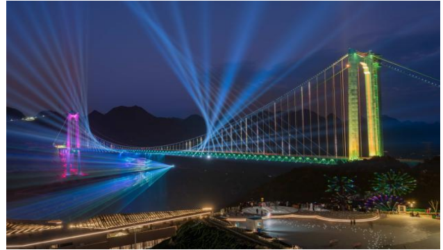
花江峡谷大桥主桥项目