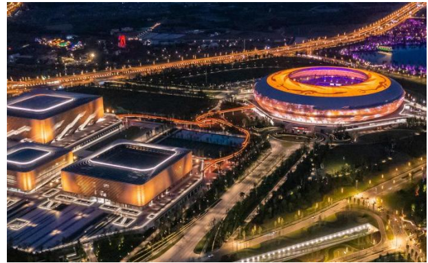
第 31 届世界大学生夏季运动会——成都世界大运公园