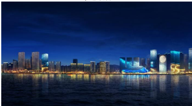
“海上游大连”智慧文旅夜游项目