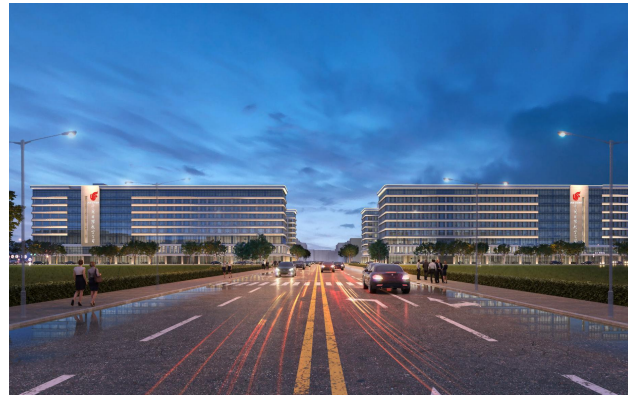
大兴国际机场国航基地项目