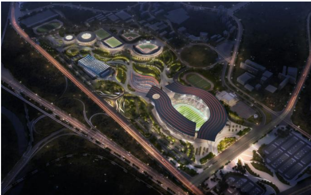
第十五届全运会奥体中心

智慧光艺是将照明与智慧化产业融合，通过与现代信息技术、物联网、大数据等技术有机结合、相互赋能、融合发展，实现在各类空间更加智能、高效和美观的照明效果。公司以“光无言，品自显”为发展理念，以卓越的设计技术、优质的施工工艺、智慧的科技手段，精益求精地打造了一个个精品类、标杆类项目。智慧光艺作为基础设施的重要组成部分，在服务美丽中国建设、城镇化发展、夜间经济发展等国家战略布局中发挥了重要作用，对于城市建设和发展、居民生活品质提升和社会经济发展起着重要的促进作用。公司以光为笔，秉持初心打造行业标杆，坚守匠心铸就荣耀品质，持续创新突破，助力国家经济可持续高质量发展。