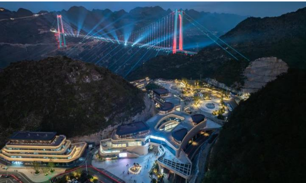
新云渡服务区项目