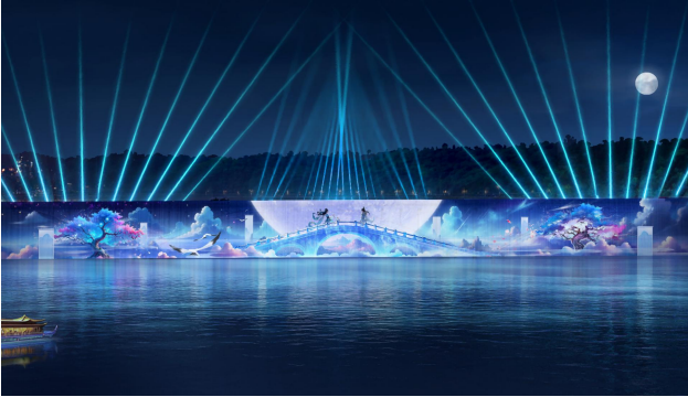
武胜县嘉陵江沿线道路工程建设项目—滨江中路配套工程总承包项目