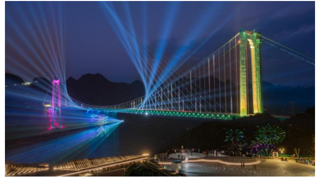
花江峡谷大桥主桥项目